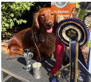
„Gucci“ - Hessensieger VDH

Im Vorfeld waren 63 Meldungen eingegangen, und am Ausstellungstag selbst fanden rund 200 Besucherinnen und Besucher aus nah und fern den Weg nach Saulheim. Viele Besucher hatten ihre eigenen Hunde dabei, was dem Ganzen zusätzlich Leben einhauchte. Bei herrlichem Wetter und in einem wunderschönen Ambiente war schnell klar: Alle Gegebenheiten für eine rundum gelungene Veranstaltung waren vorhanden. Im Mittelpunkt standen natürlich die Hunde.